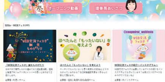
当日の会場の様子

2月18日(木)、初の試みとなる1日限りのオンラインイベント「コープみらいWEB交流フェスタ」を開催しました。ブロック委員会では、実会合が制限されたコロナ禍において、コミュニケーションの方法を工夫しながら活動を進め、その取り組みを発信する場となりました。「食と商品」「環境」などの9つのテーマで、85の企画が展覧されました。当日は、のべ2000人の参加がありました。