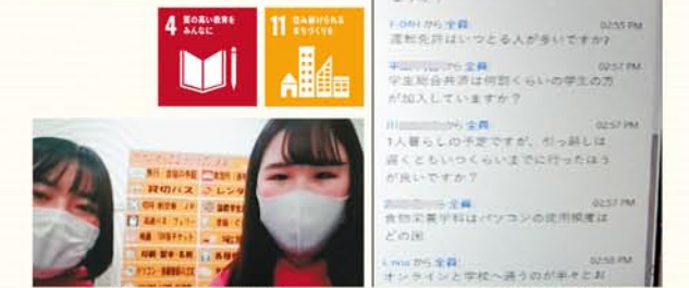
質問に答える先輩学生 チャットに書き込まれた質問

十文字学園生協では、1月31日(日)に第1回目の説明会をZoomで開催しました。コロナ禍前は、大学主催のセミナーの中で生協・共済の説明を、食堂ではパソコン、教材などをブース形式で紹介していました。21年度対面式での大学セミナーは中止となりましたが、新入生と保護者の不安解消に少しでも役立ちたいという思いから、オンラインでの説明会を実施しました。質問コーナーではチャットで新入生の方からの質問を書き込んでいただき、先輩学生が答えました。コロナ禍の授業(遠隔授業)について、パソコンの利用頻度などについての質問が多く寄せられていました。2月以降も説明会をオンラインで行いました。この活動により新入生、保護者の方の不安の解消につながればと思います。