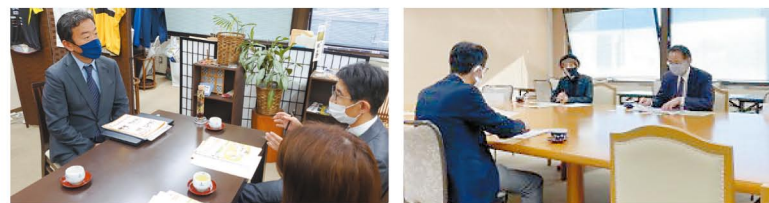
12月14日 無所属改革の議員との懇談 1月19日 日本共産党埼玉県議員団との懇談

生協への理解を深め、意見交換を行う場として埼玉県議会3会派との懇談会を実施し、8人の県議会議員が参加しました。感染防止対策を行い、少人数、短時間で開催しました。