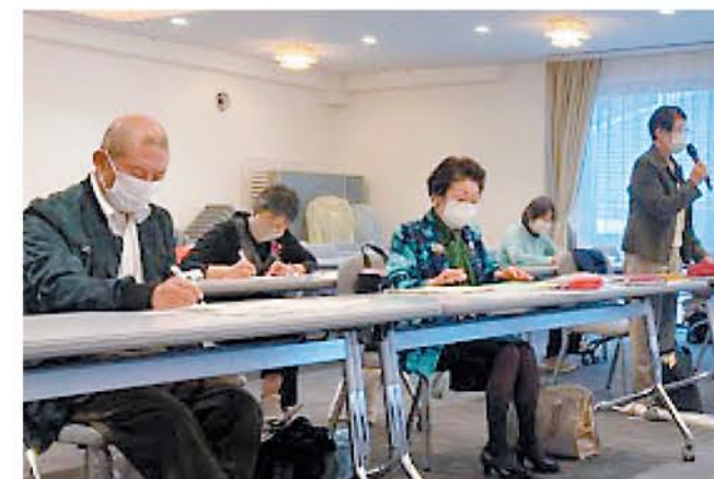
要請の中で重点とした14項目について回答いただき、質疑応答をおこないました

新型コロナウイルス感染拡大防止のため、最小限の人数で開催、埼玉県からは7部局10課11人、実行委員会からは埼玉消団連を中心に9団体11人が参加しました。