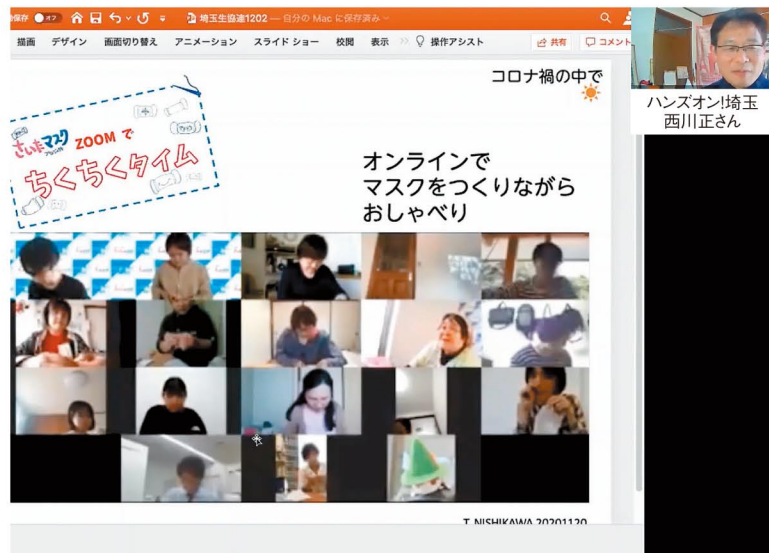
西川さんから、オンラインでのさまざまな活動を紹介いただきました