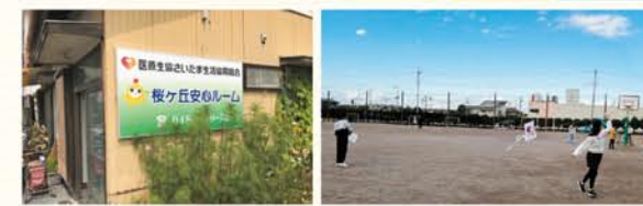
安心ルーム外観 2月 近くの桜ヶ丘小学校でたこあげ

地域に開かれた組合員活動の場として「支部活動拠点づくり」を進め、現在は県内5カ所に設置され、様々な活動を展開しています。行田東支部は、2018年4月に、学童保育に入れなかった子どもたちのために放課後の子どもの居場所として「桜ヶ丘子ども安心ルーム」を開始しました。2020年4月からは大人の居場所「桜ヶ丘安心ルーム」として活動しています。新型コロナウイルス感染症の影響で大人の居場所は休止していますが、放課後のこどもの居場所は要望が強く、感染予防対策を実施しながら、継続して活動しています。