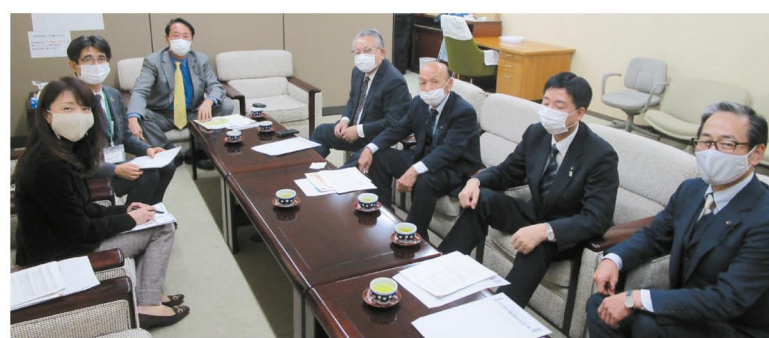
1月7日 自由民主党議員団役員との懇談

オンラインで2人参加し、質疑応答もおこないました 食品安全局6人、消費者団体7人の参加で対面(オンライン併用)で開催、埼玉県食品衛生監視指導計画、食中毒の状況、コロナ禍における保健所の現状、HACCP、鳥インフルエンザ等をテーマに説明いただき、意見交換をおこないました。