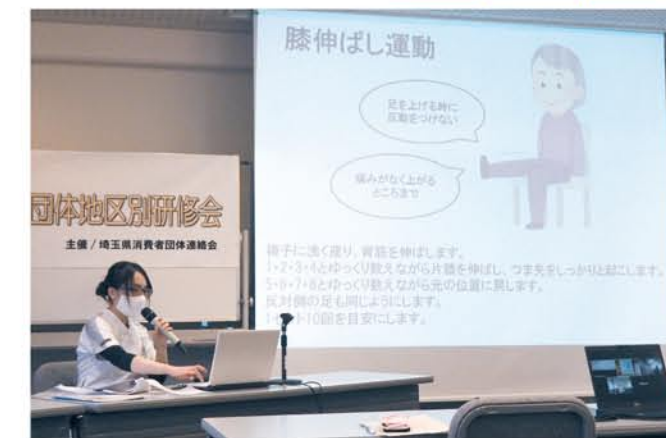
医療生協さいたまによる「フレイル予防」についての講義 各会場実技もおこないました

「フレイル予防について」「消費者被害防止について」、浦和をメイン会場に川越、上尾、久喜各会場で同時開催し、21団体111人が参加しました。