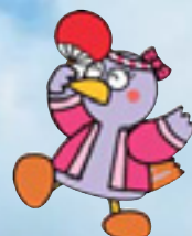
埼玉県のマスコット コバトン