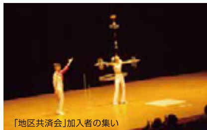
「地区共済会」加入者の集い

全労済は共済事業を通じて、「みんなで助け合い豊かで安心できる社会づくり」の理念のもと、組合員やその家族の暮らしに「安心」を届けるために「助け合いの輪」を広げる活動を展開しています。