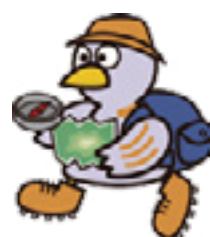
埼玉県のマスコット コバトン