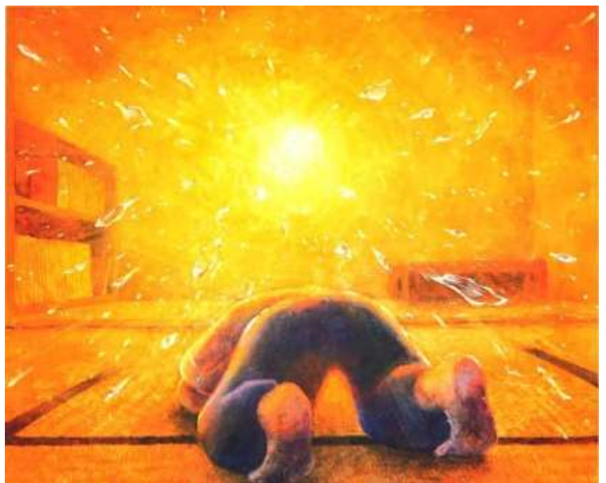
高校生が描いた原爆の絵 「閃光」